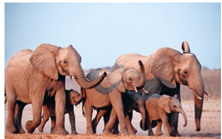
Der WWF bietet Spiele und Geschichten zu den Elefanten.