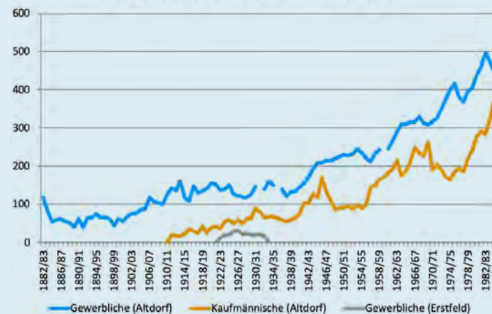
Lernende in den gewerblichen und kaufmännischen Fortbildungsschulen, 1882/83–1985/86

besondere Subventionen geltend gemacht werden.