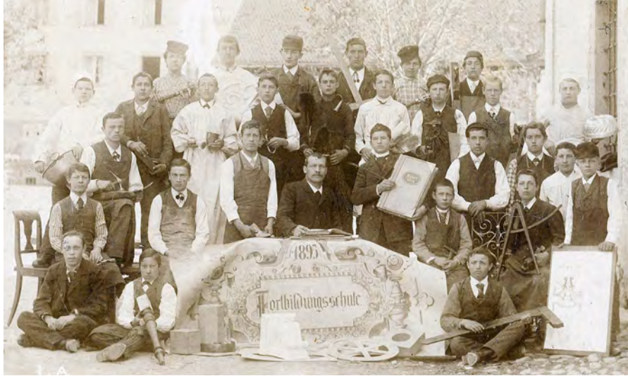
Foto der gewerblichen Fortbildungsschule in Altdorf, 1895

haltungskurs für Töchter. Besonders die Zeichnungsschule hatte gegenüber der allgemeinen Abteilung mit Anlaufschwierigkeiten zu kämpfen. Sie war vergleichsweise weniger frequentiert und musste im Schuljahr 1892/93 mangels einer geeigneten Lehrkraft sogar geschlossen bleiben.