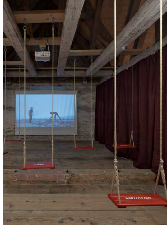
Ausstellung im Nidwaldner Museum Salzmagazin / Mundart in der Deutschschweiz, Foto: Christian Hartmann

In der Schweiz regierte nie ein König, der seinen Dialekt (zum Beispiel Berndeutsch) zur Nationalsprache hätte erklären können. Darum gibt es kein Schweizerdeutsch und alle Dialekte überlebten dank dem Föderalismus. Zur schriftlichen Verständigung wird aber ein neutrales Deutsch benutzt: das Schrift-