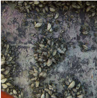
oben Bewuchs an Bootsrumpf

Trocknen Sie die Ausrüstung vor der Nutzung auf einem anderen Gewässer vollständig.