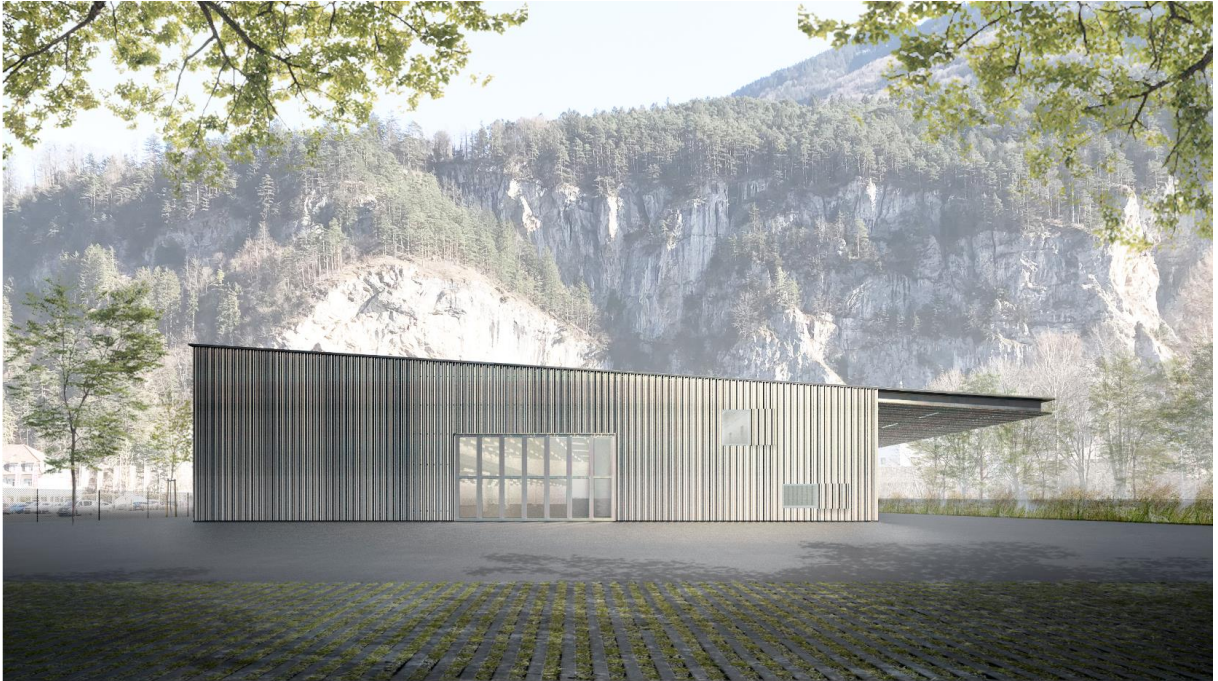
Abbildung 5: Visualisierung Westfassade