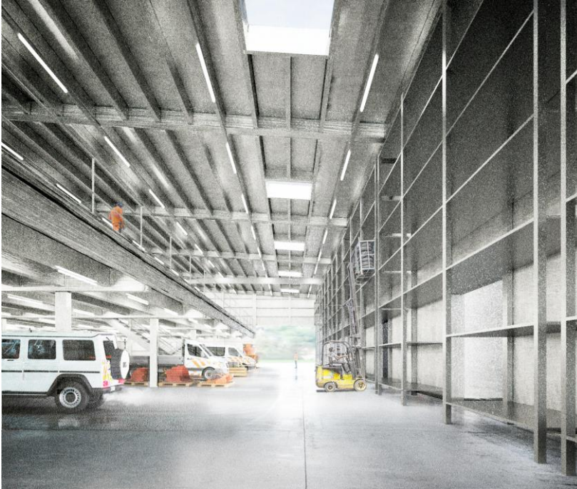
Abbildung 4: Visualisierung innere Fahrgasse