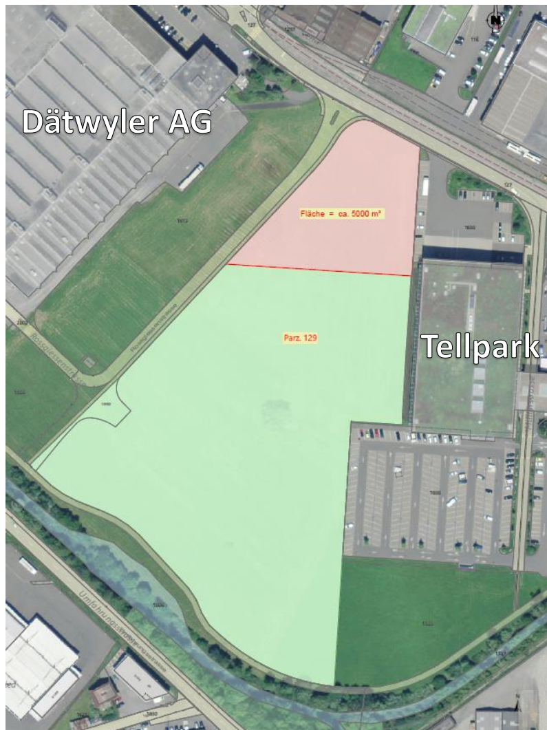
Abbildung 1: Der Erwerb der Parzelle nordwestlich des Einkaufszentrums wurde im Projektionskredit vom Kanton angestrebt (Stand März 2018).

Der Standort im Industriegebiet Schattdorf (Rossgiessen) überzeugt nach wie vor und wird vonseiten des Kantons nicht in Frage gestellt. Im Sinne einer guten Partnerschaft mit der Standortgemeinde wurden jedoch weitere Alternativen gesucht. Eine Parzelle weiter südlich neben den Hallen der Zraggen Fahrzeugvermietung & Carreisen wurde evaluiert und von der Gemeinde klar favorisiert. Nach mehreren intensiven Gesprächen zeigte sich der Kanton bereit, auf die raumplanerischen Anliegen der Gemeinde einzugehen.