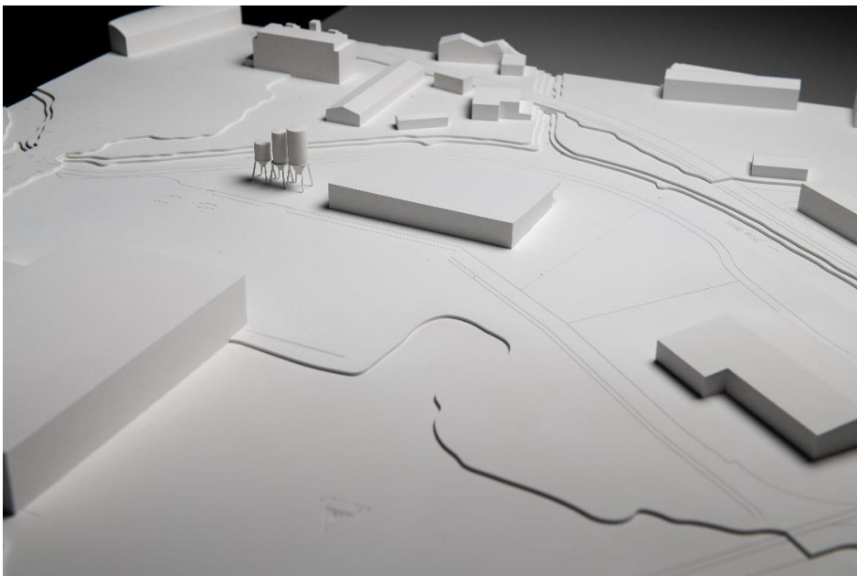
Abbildung 3: Modellfoto Siegerprojekt «Buddy» (Mai 2020)

Der Regierungsrat erteilte im Juni 2020 dem Siegerteam den Auftrag zur Weiterbearbeitung des Wettbewerbsprojekts bis und mit Planungsphase Bauprojekt (inklusive Kostenvoranschlag +/-10 Prozent). Die Wettbewerbsprojekte wurden der Bevölkerung im Juli 2020 anlässlich einer wöchigen Ausstellung in der Kantonalen Mittelschule Uri in Altdorf präsentiert.