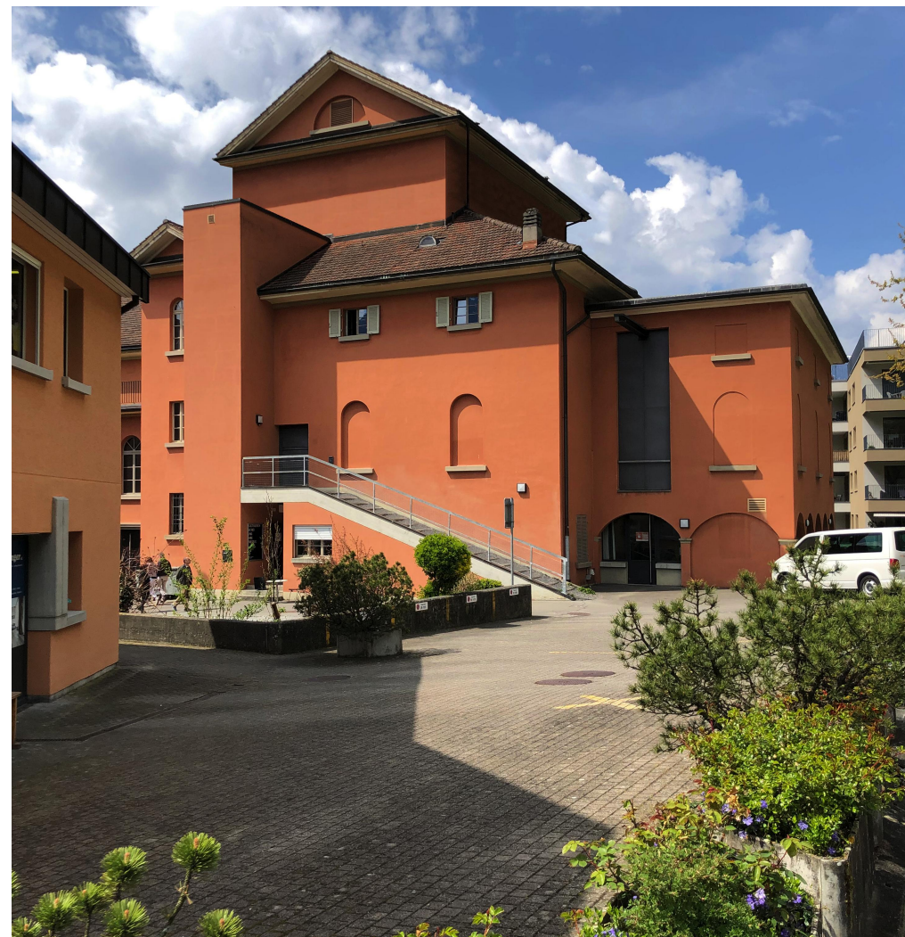
TELLSPIELHAUS BÜHNENDACH UM CA. 1.60 m ERHÖHT