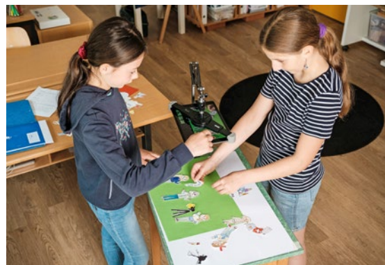
Zwei Schülerinnen gestalten einen Film.