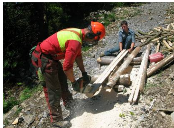
Aufsägen der Latten