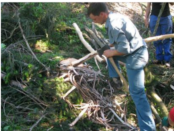
Schälen der Rinde