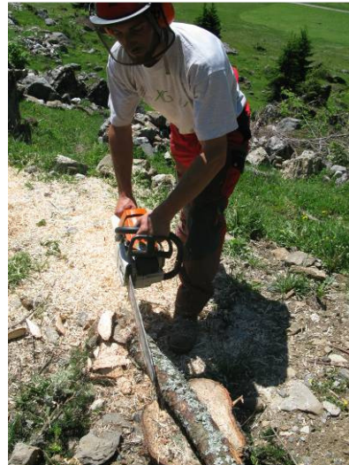
Anspitzen der Stecken