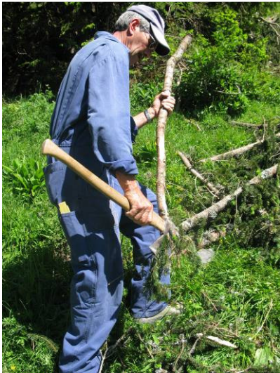
Entfernen der Seitentriebe