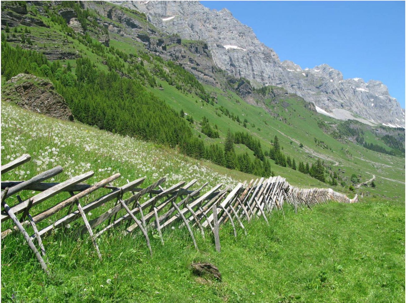
Bestehender, traditioneller Scharhag auf dem Urnerboden