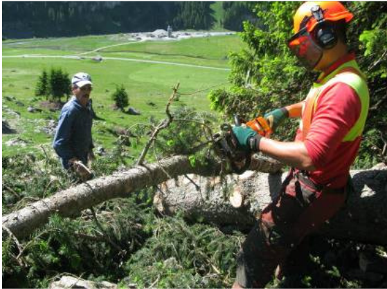
Ablängen der Äste