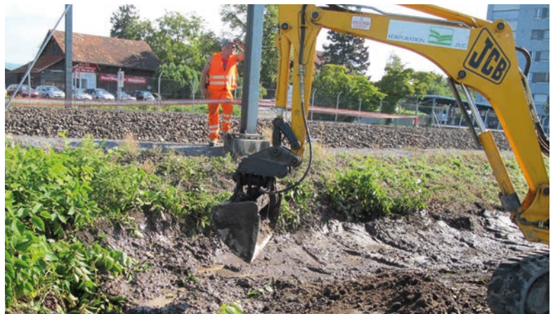
Ausbaggerung von Japanischem Staudenknöterich