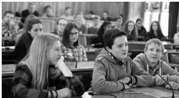
Im Jugendparlament konnte man politische Luft schnuppern. (Altdorf, 11. November 2016)